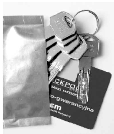
zabezpieczone klucze i karta kodowa

Wkładka dedykowana szczególnie dla producentów stolarki oraz salonów sprzedających drzwi, a także firm deweloperskich. Dzięki specjalnej konstrukcji finalny użytkownik ma gwarancję, że niepowołane osoby nie miały wcześniej dostępu do jego kluczy. Wkładka dostarczana jest z tzw. kluczem serwisowym wykonanym z mosiądzu oraz specjalnie zabezpieczonymi przed osobami niepowołanymi kluczami użytkownika. Montaż drzwi i wkładki odbywa się przy użyciu klucza serwisowego. Po wyjęciu z zaplombowanego opakowania kluczy użytkownika ich pierwsze użycie powoduje, że klucz serwisowy trwale przestaje działać. Osoba która miała dostęp do klucza serwisowego nie ma już możliwości otwarcenia drzwi. Tak więc nawet w trakcie trwania budowy wykonawcy mogą mieć dostęp do obiektu a po zakończeniu prac bez konieczności wymiany wkładki ten dostęp zostaje im odebrany.