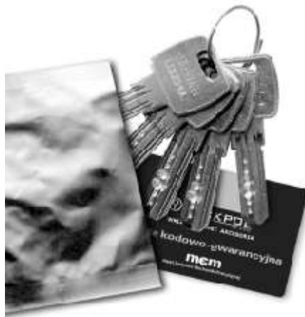
Zabezpieczone klucze i karta kodowa

Wkładka dedykowana szczególnie dla producentów stolarki oraz salonów sprzedających drzwi, a także firm deweloperskich. Dzięki specjalnej konstrukcji finalny użytkownik ma gwarancję, że niepowołane osoby nie miały wcześniej dostępu do jego kluczy. Wkładka dostarczana jest z tzw. kluczem serwisowym wykonanym z mosiądzu oraz specjalnie zabezpieczonymi przed osobami niepowołanymi kluczami użytkownika. Montaż drzwi i wkładki odbywa się przy użyciu klucza serwisowego.