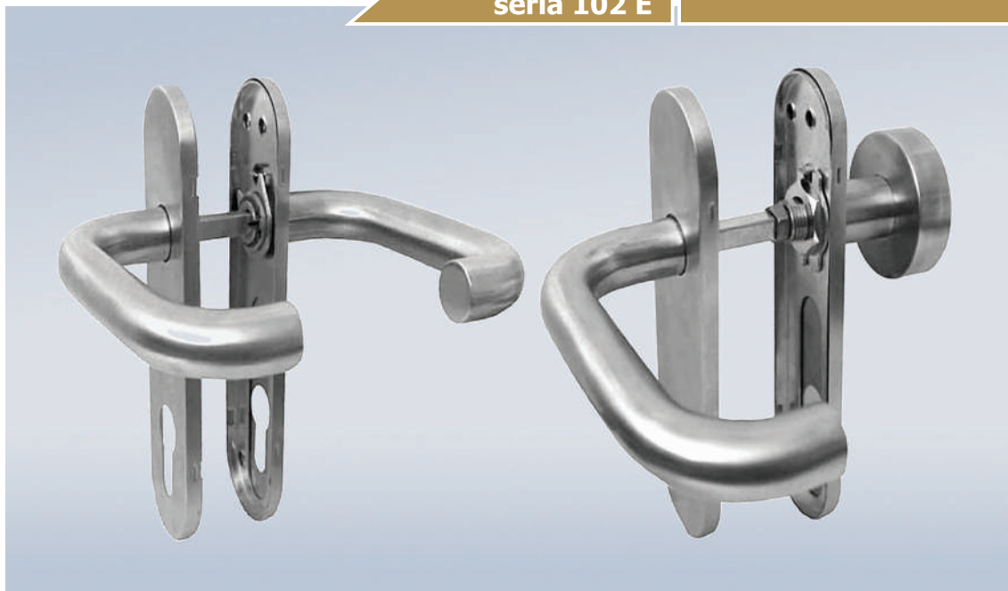
In 102/102 E